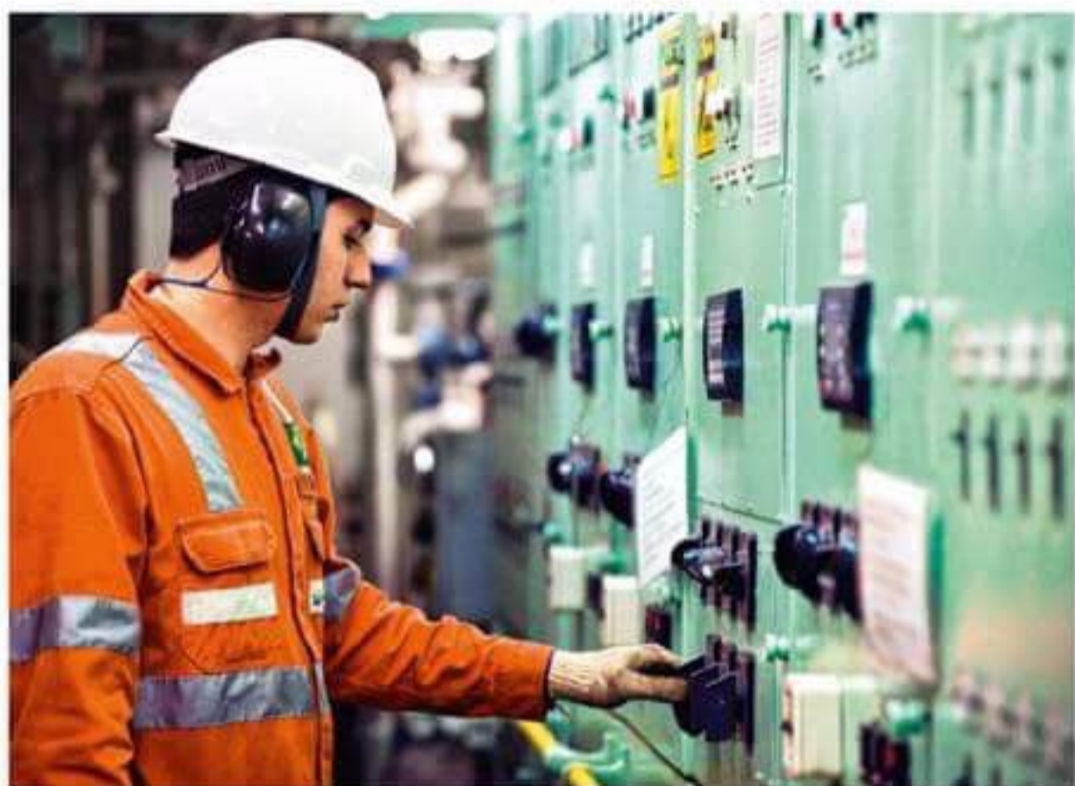
Funcionários públicos: a crise afetou menos o rendimento dos servidores com ensino superior